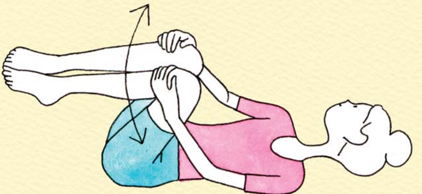
Step 2 腰の下のほうを床にこすりつけながら体を動かし、イタ気持ちよく感じられる部分を集中的に刺激する。

監修/松岡 博子 新宿高田馬場にてアピア均整院主宰。一般社団法人 身体均整師会理事。当研修センターでは施術体験者募集中。 http://www.kinsel-gakuen.com/egg.html