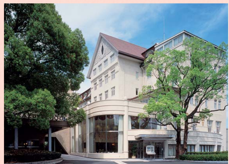
宝塚ホテル。映画にも原作にも象徴的な存在として登場する。1926年創業、クラシックなたたずまいの名門ホテル。宝塚大劇場に近く、プライダルでも人気。宝塚南口駅下車すぐ