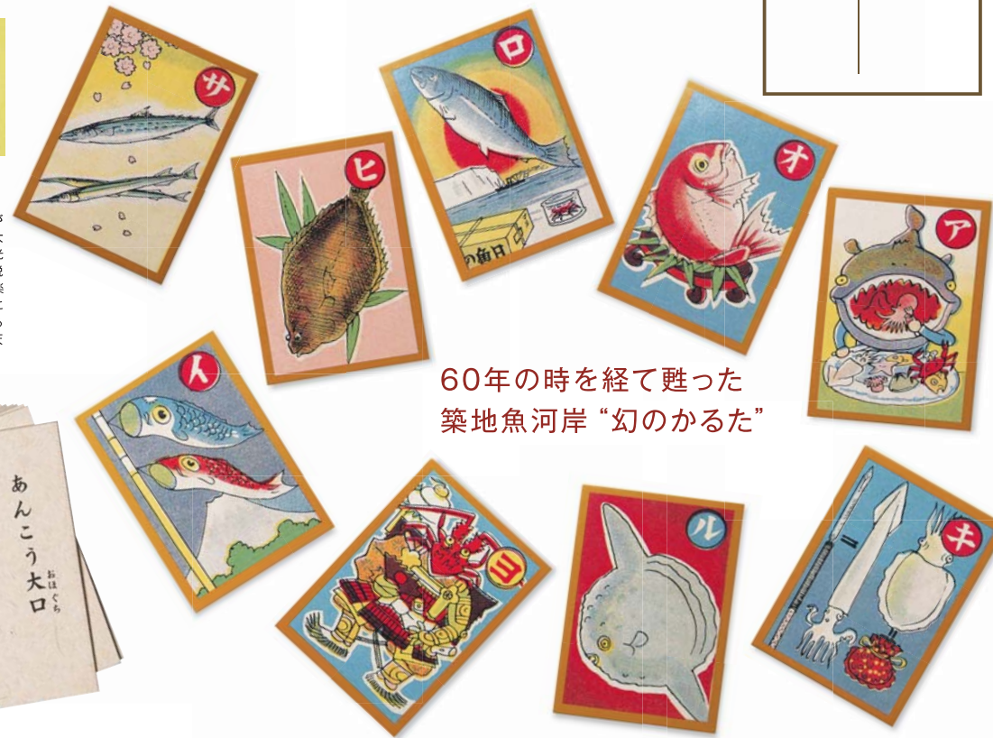
60年の時を経て甦った 築地魚河岸「幻のかるた」