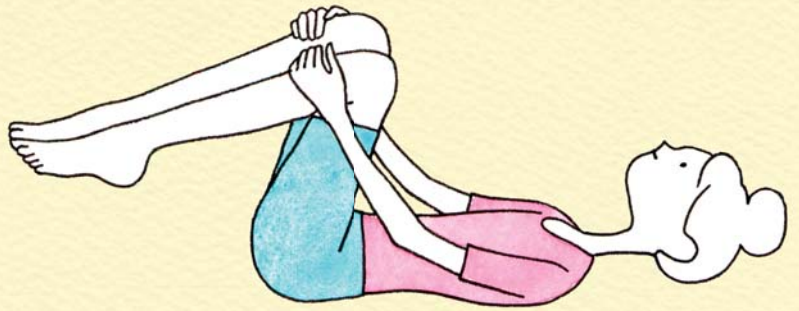
Step 1 あお向けに寝て、両ひざを胸につけるようにして抱え込む。