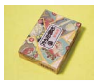
復刻版 お魚かるた 読札48枚・取札48枚 2310円 取札にはユニークなイラストが描かれ、読札には「アンコウ大口なんでも食べる」「目玉が光る金目鯛」などとともに、解説が記されており、魚のことを楽しく学びながら遊べる。なかには戦前の時代背景を感じさせる札も。製造元はおなじみの任天堂。発売元は奥野かるた店。

■問い合わせ 奥野かるた店 〒101-0051 東京都千代田区神田保町2-2-6 TEL03-3264-8031