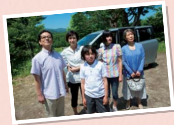
震災直後の撮影のため、ロケ地変更も検討されましたが、監督の和泉聖治さんや水谷豊さんらが「岩手の物語なのだから岩手でロケをしよう」と後押ししたのだそう