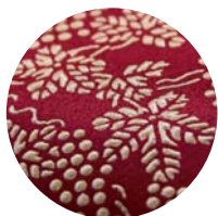
印伝の大きな魅力は、とんぼ、小桜、青海波など江戸小紋にもみられる伝統柄。自然や美しさ愛する日本の美意識から生まれ、その柄の数はなんと数百種類にもものぼる。