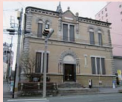
市内中心部にあるもりおか啄木・賢治青春館。1910年(明治43)、銀行として建てられたもの

2012年6月9日(土) 9:30~13:55 鬼越蒼前神社(滝沢村)~盛岡八幡宮(盛岡市) ※当日は盛岡駅~鬼越蒼前神社間に無料シャトルバス運行予定