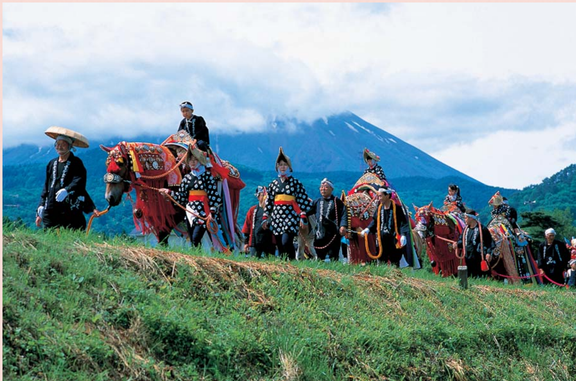
チャグチャグ馬コ。滝沢村の鬼越蒼前神社から盛岡市の盛岡八幡宮まで約15kmを100頭近くの馬が行進する。飾りの鈴の音が名前の由来といわれています。国の無形民俗文化財。滝沢村では学校の撮影が行われました

■アクセス 東京駅から東北新幹線で最速2時間20分、盛岡駅下車 ■観光の問合せ 盛岡市観光コンベンション協会 019-604-3305