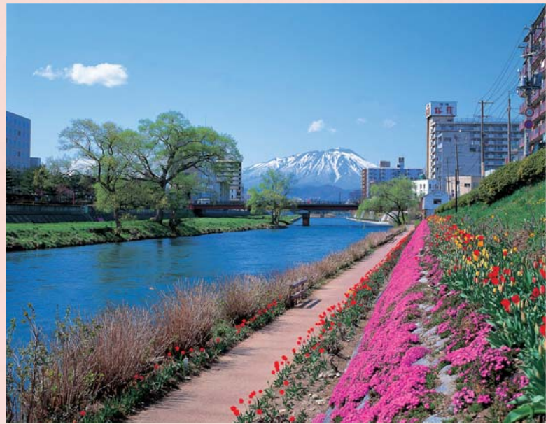
盛岡市中心部を流れる北上川。奥は残雪の岩手山