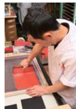
漆付けの様子。漆を手作業で均等に塗っていく工程は職人の高度な技が必要とされる。

印伝とは「印度伝来」の略。17世紀の南蛮貿易で東インド会社より輸入された装飾革がはじまりだと伝えられています。戦国時代には武士の鎧や兜を華々しく飾り、江戸時代には上原勇七（現十三代目）が鹿革に漆付けする独自の技法を創案。以降400年受け継がれる伝統工芸「甲州印伝」の起源となりました。江戸の人々に愛され「腰に下げたる、印伝の巾着を出だし、見せる。」と、十返舎一九の滑稽本『東海道中膝栗毛』にも記されています。印伝の素材は柔らかくしなやかな鹿革と光沢が美しい漆。四方を山に囲まれた自然豊かな甲州の環境の恵みを受けながら、印伝の技と心が伝承されてきました。使い込むほどに手に馴染み、品質へのこだわりを実感できる逸品です。