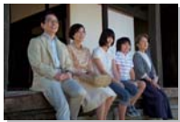
『HOME 愛しの座敷わらし』公開中 監督：和泉聖治 脚本：金子成人 ©2012『HOME 愛しの座敷わらし』製作委員会

取材・文／星 裕水(ほし・ひろみ) 出版社勤務を経てトラベルライター兼編集者に。 編集を手がけた『JTBの交通ムック 旅客機と空港のすべて』(JTBパブリッシング)好評発売中!