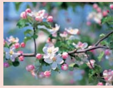
りんごの花。5月から6月にかけて満開に

夏の空は青く、緑の森は風にざわめく…。父の転勤で引越越したのは、岩手の片田舎。会社、学校、家庭、それぞれの「しがらみ」に共感し、涙しながらも、明日への勇気が生まれます。