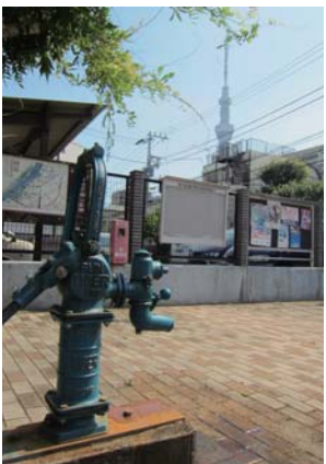
井戸のある広場。商店街から東京スカイツリーが見える唯一の場所

■アクセス 鳩の街通り商店街へは、東武スカイツリーライン曳舟駅下車、徒歩5分 ■観光の問合せ 墨田区観光協会 03-5608-6951