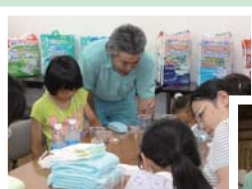
開発部員による 工場内部説明

皆様の心温まるご協力で深く感謝致しますとともに、被災されました皆様の一日も早い復旧を心よりお祈り申し上げます。