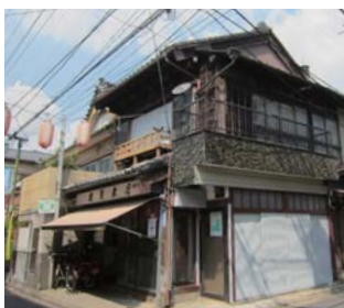
脇道に入った路地裏は民家が密集し、昭和の面影がとどこころに

商店街には写真のお米屋さんをはじめ、木造建築の店舗が多く、若者の目には新鮮に映る