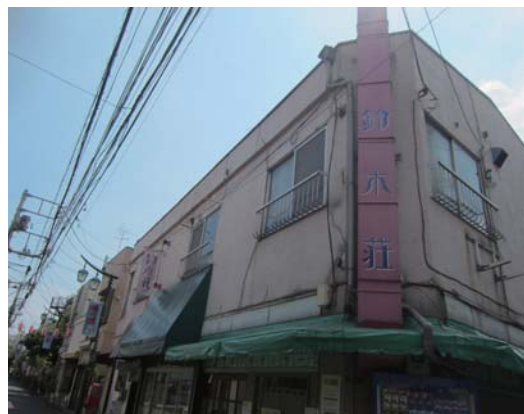
紙工房や雑貨店などが入る「鈴木荘」