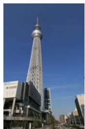
スモ活用し、時間や体力に合ったルートを選んでください。