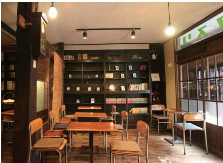
鳩の街通り商店街にある古民家カフェ「こくま」。昭和2年築という木造建築。机とイスに思わず歓声

■アクセス 鳩の街通り商店街へは、東武スカイツリーライン曳舟駅下車、徒歩5分 ■観光の問合せ 墨田区観光協会 03-5608-6951