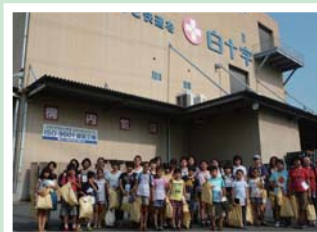
工場前にて参加者全員で記念撮影

7月30日(月)、白十字の本社がある豊島区の小学4・5年生を対象に豊島区親子工場見学会が開催されました。 酷暑の中ではありましたが、群馬工場の見学会に親子20組が参加されました。