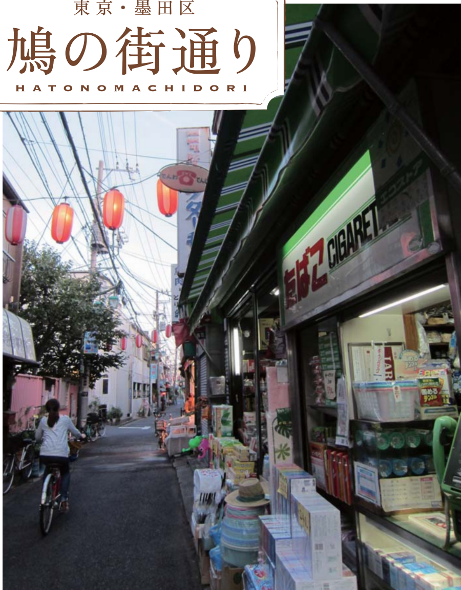
夕方の鳩の街通り商店街