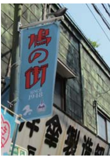
フラッグの上にも鳩のオブジェが