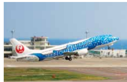
ジンベエザメが空を飛ぶ!? JTA (日本トランスオーシャン航空) の特別塗装機を偶然目撃♡

青空には白い絵の具をふわっとのせたような雲が浮かび、石垣島はすっかり夏モード。新空港開港初日に東京から直行便に乗り、お祝いムードに包まれた島を訪ねてきました。そこには昔から変わらぬ美しさをたたえたサンゴ礁の海と、時代の変化と共存しながら歩む暮らしがありました。