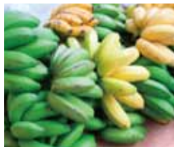
島バナナは小ぶりでも甘くておいしい

店街の公設市場には、島の野菜や魚がずらり。住宅街に建ち並ぶコンクリート製の建物は、台風にも負けない頑丈さ。壁に直接ペンキで店名を描いたりするカラフルなペイントは、南の島の明るさを感じさせてくれることでしょう。アーティストのショップで一点モノを探すのも楽しいですよ。時間の流れはどこまでも穏やか。路地をめぐっていたら、稽古中なのか、三線の音色と島唄が聞こえてきました。夜は民謡酒場に出掛けるのも一興。若夏と呼ばれる5月の沖縄では、暑さ対策と水分補給をお忘れなく。氷ぜんざいやさんびん茶で涼をとるのもいいものです。