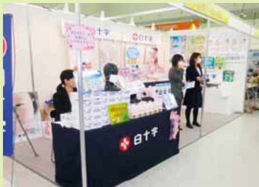
白十字ブースの様子

「としまものづくりメッセ」とは、区内の基幹産業である印刷業をはじめ、精密機器・金属製品等の製造業や、独自の技術を持った企業などが集まり、優れた製品や技術を一堂に展示する池袋副都心の産業見本市です。当社も豊島区に本社を置く会社として、毎年参加をしています。この産業見本市の開催目的は、販路拡大や企業間の交流によって区内企業のさらなる発展を支援し、地域経済の活性化を図ること。そして、ものづくりに触れる多彩な企画を通じて、一般の皆さまに地域産業に対する理解を深めてもらうことです。