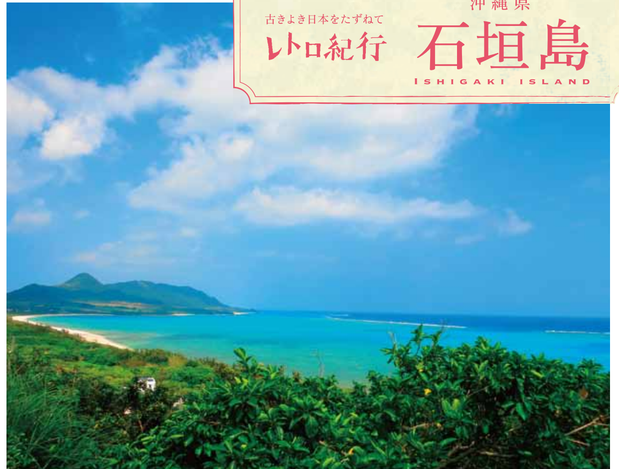
島屈指のビューポイント、玉取崎展望台にて。空港移転でアクセスしやすくなりました