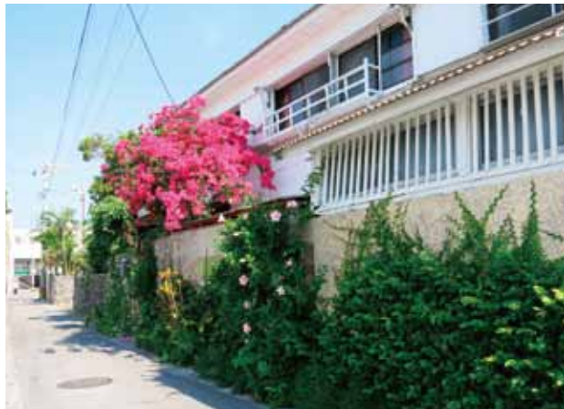
中心部をあてもなく歩いていたら、趣ある道に出ました。お花いっぱい民宿でした

■アクセス 南ぬ島石垣空港へは那覇から約1時間。羽田、中部、関西などから直行便あり。空港から市内中心部まではバスで約30分。 ■観光に関する問合せ 石垣市観光交流協会 0980-82-2809