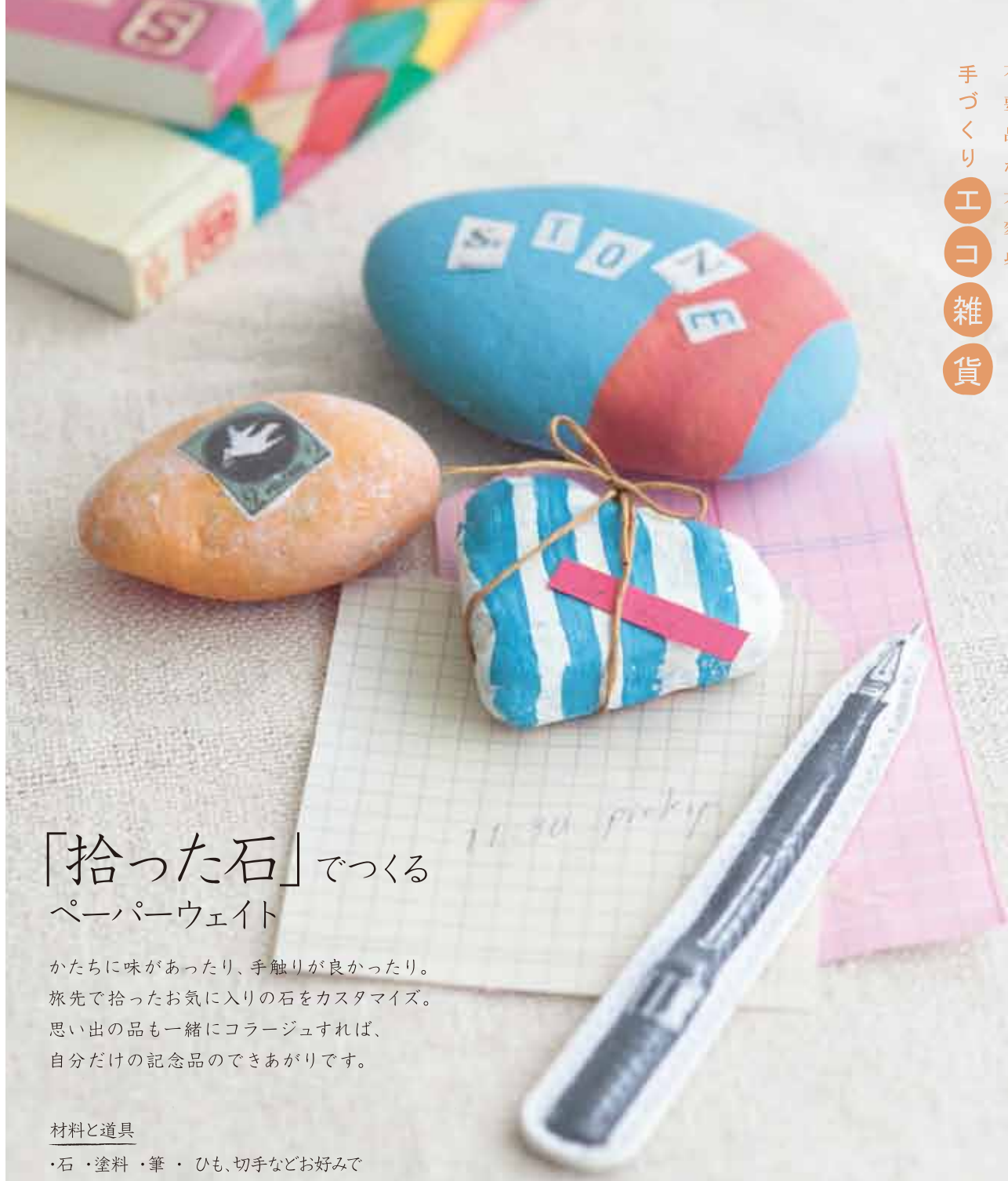
イラスト/タケイエミコ