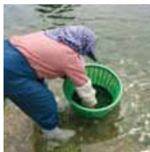
浜でアーサー(海藻)を採っていたお母さん。「味噌汁もいけど天ぷらがおすすめね」

新空港が位置しているのは島東部の白保。国道から集落の脇道に入ると、しんとした静けさに気持ちがあなごみます。石垣に囲まれた民家やフクギ並木を通り抜けると、目の前は一面の海。沖には世界最大級のアオサンゴ大群落があることで知られています。集落内にはしらはサンゴ村など、自然との共生に思いをめぐらせるスポットも。道行く人と挨拶を交わしながらのんびり散策してみたい場所のひとつです。