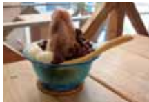
沖縄でぜんざいといえばあずきがのったかき氷のこと

店街の公設市場には、島の野菜や魚がずらり。住宅街に建ち並ぶコンクリート製の建物は、台風にも負けない頑丈さ。壁に直接ペンキで店名を描いたりするカラフルなペイントは、南の島の明るさを感じさせてくれることでしょう。アーティストのショップで一点モノを探すのも楽しいですよ。時間の流れはどこまでも穏やか。路地をめぐっていたら、稽古中なのか、三線の音色と島唄が聞こえてきました。夜は民謡酒場に出掛けるのも一興。若夏と呼ばれる5月の沖縄では、暑さ対策と水分補給をお忘れなく。氷ぜんざいやさんびん茶で涼をとるのもいいものです。