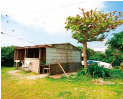
海とともに生きてきた白保。浜辺には小屋と椅子がありました