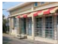
商店ではご当地らしい飲み物やお弁当を探してみて