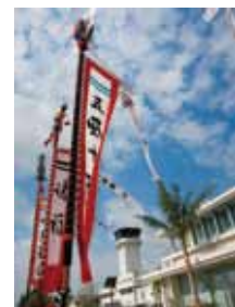
開港初日の空港には開港を祝うのぼりがはためいていました