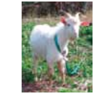
白保集落で見かけたヤギ。島のあちこちで飼われています