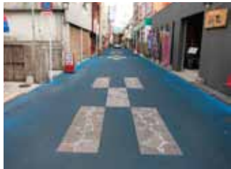
道路にもミンサー織りの模様「いつ(五)の世(四)」が

優雅なリゾートも魅力的ですが、ちょっとお散歩してみませんか。棧橋や市役所のある中心部は徒歩で巡れるほどコンパクト。商