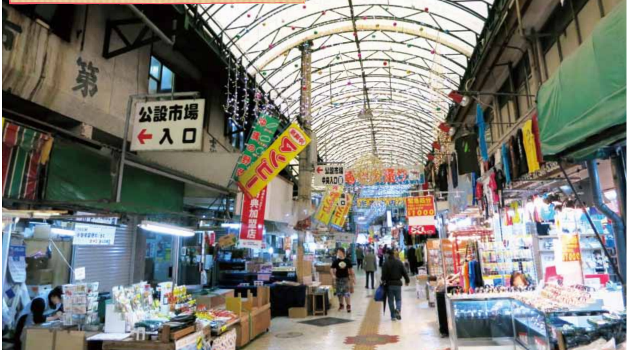
観光客と地元客が行き交う第一牧志公設市場周辺のアーケード。クリスマス時期だったので天井がきらびやか!