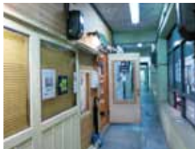
昔の学校の廊下や事務所のような建物。それぞれこだわりの世界が広がります

沖縄の郷土菓子、サーターアンダギーを買い食いしつつ、ふと上を見上げたら「水上店舗」となにやらかわいい看板が。階段を上ってみると、昭和レトロな空間にびっくり。ギャラリーや雑貨店などちよつとした隠れ家的スポットとなっています。地元クリエイターとの触れ合いやひと味違うお土産探しができそうです。