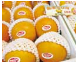
あまちゃん?いいえ「あまSUN(サン)」です。冬にしか出回らない貴重な沖縄産高級みかん