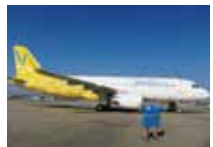
取材・文/星 裕水 (ほし・ひろみ)