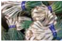
伊江島の島ラッキョウは塩漬けに