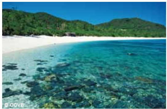
座間味島のビーチは4月に海開き予定

いざ出航! ホエールウォッチング 冬から春にかけては慶良間諸島周辺にザトウクジラが姿を現します。1月〜3月にはクルージングツアーも実施。那覇発の日帰りツアーもありですが、美しいビーチを見るなら泊埠頭から船で座間味島(高速船で最速1時間)まで出掛けるのもおすすめ。ダイナミックなジャンプにプロウ(潮吹き)、尾びれをぱしっと海にたたきつけるようなテイルスラップなど、間近で眺めるクジラのパフォーマンスは大迫力です。