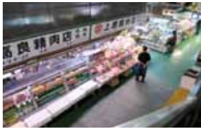
第一牧志公設市場。1階は鮮魚や精肉専門店がならび、2階は食堂街となっている