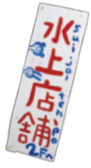
水上店舗? うーん、気になる