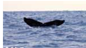
北極圏に棲息しているザトウクジラが温暖な慶良間にやってくるのは繁殖や子育てのためだとか

いざ出航! ホエールウォッチング 冬から春にかけては慶良間諸島周辺にザトウクジラが姿を現します。1月〜3月にはクルージングツアーも実施。那覇発の日帰りツアーもありですが、美しいビーチを見るなら泊埠頭から船で座間味島(高速船で最速1時間)まで出掛けるのもおすすめ。ダイナミックなジャンプにプロウ(潮吹き)、尾びれをぱしっと海にたたきつけるようなテイルスラップなど、間近で眺めるクジラのパフォーマンスは大迫力です。