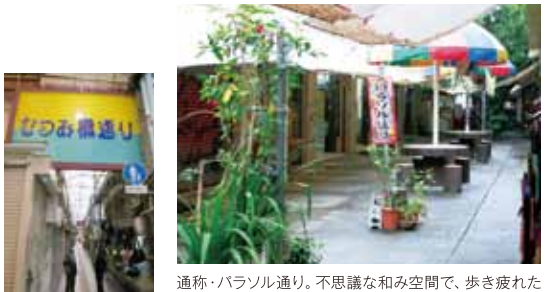
通称・パラソル通り。不思議な和み空間で、歩き疲れたらここで小休止 むつみ橋通り。くるんとした文字がキュートでつい1枚

那覇市内観光周遊バス「ゆいゆい号」 2013年6月から始まった周遊バス。那覇バスターミナルから首里城や石畳の道、DFSなど観光スポットを一周に循環する。1回乗車220円、1日乗車券660円。