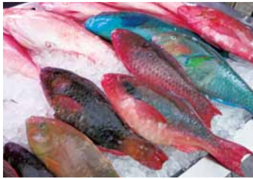
カラフルな魚たち。刺身はもちろん、から揚げ、バター焼きも美味