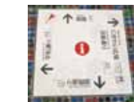
さて、どちらに行きましようか