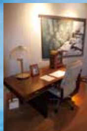
遠藤周作文学館。ファンならぜひ訪れたい