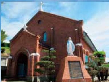
旧黒崎村にたたずむカトリック黒崎教会。レンガ積み の聖堂です。トモギ村に思いをはせてみて

旅はイメージでいいし、でもっと楽しくなるもの。バッグに本を1冊しのばせて、名作小説の舞台を訪ねます。今回は「沈黙」、遠藤周作の代表作です。今回は観光都市長崎を中心に歴史散歩に出掛けてきました。春めく坂の町で、ちょっと大人の修学旅行です。