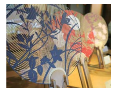
鑑賞・インテリア用の「両透かし」のうちわ。優美なデザインと細工は、もはや芸術品

あおぐことを目的とした実用うちわ。「片透かし」や、透かし柄をアクセントとして入れた「両透かし」など多彩。夏は金魚や朝顔、花などのデザインが人気