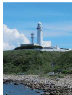
開放感たっぷりの犬吠埼。初日の出スポットとしても有名

線の旅を楽しむのも一興です。終着駅である外川の漁港周辺には、古い漁師町の面影が残っています。 名物グルメはもちろん海の幸。生マグロのほか、ぜひ味わいたいのが「入梅イワシ」。6〜7月の梅雨の時期に銚子で揚がるイワシはつやつやで脂がのり、もっとも美味しいといわれています。銚子ではカキも初夏が旬。「磯ガキ」と呼ばれる岩ガキは濃厚な旨味が特色です。 旧暦の6月15日（今年は7月18日）には海の安全と大漁を願う「大潮まつり」が行われ、勇壮な御輿が練り歩くほか、銚子漁港も大漁旗で彩られます。