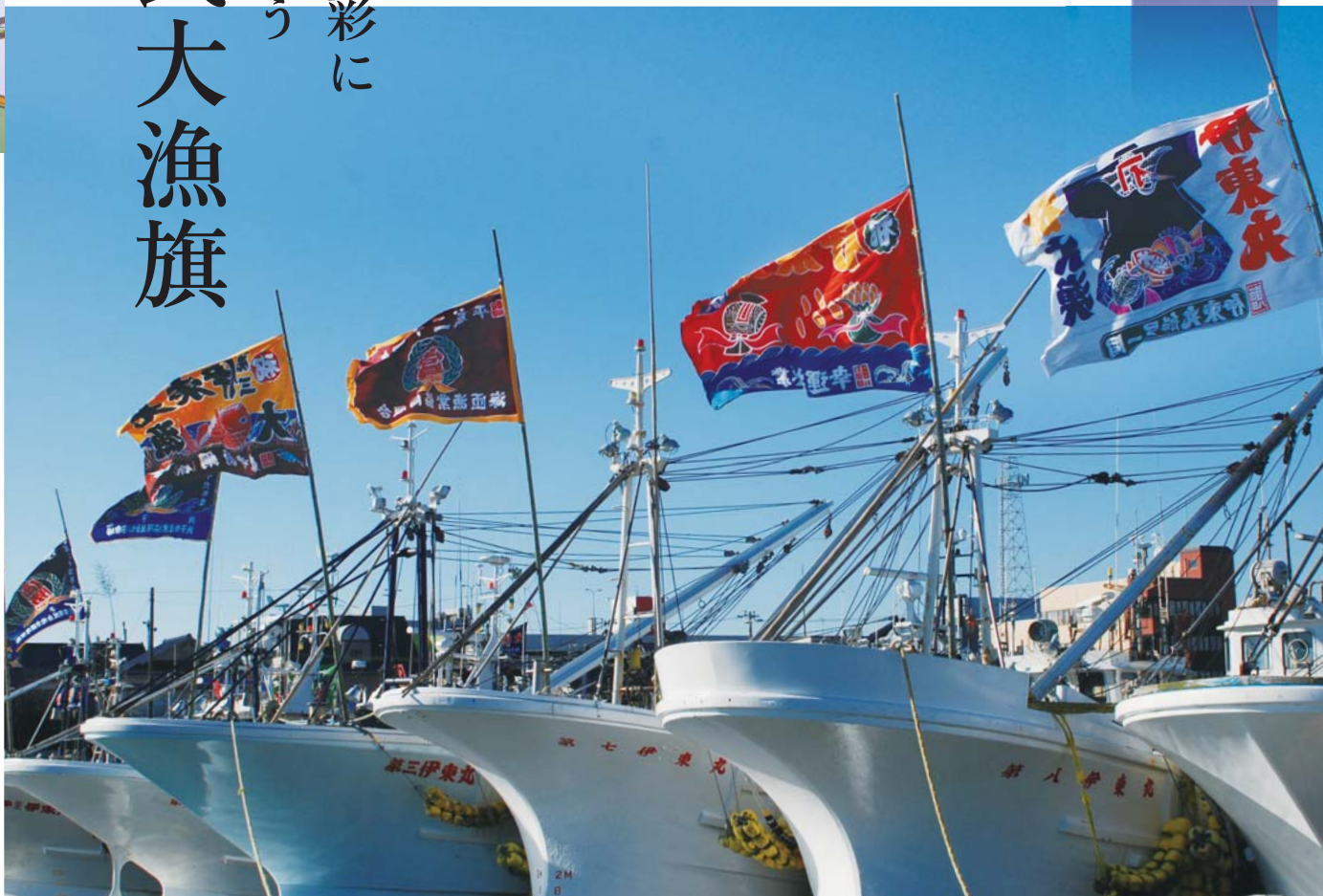
お正月の外川漁港