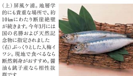
(上) 屏風ヶ浦。地層学的にも貴重な場所で、約10kmにわたり断崖絶壁が続きます。今年3月には国の名勝および天然記念物に指定されました(右) ぷっくりとした入梅イワシ。現地でも食べるなら断然刺身がおすすめ。醤油も銚子産なら相性抜群です

文/星 裕水 (ほし・ひろみ) トラベルライター・編集者。日本旅行作家協会正会員。編集を手がけた「京都鉄道博物館のすべて」(JTBパブリッシング)が好評発売中!