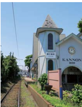
(下) 銚子電鉄は駅ごとに個性があります。観音駅はメルヘンチックな駅舎で、構内にあるたい焼き屋が有名。銚子漁港へはここから徒歩10分