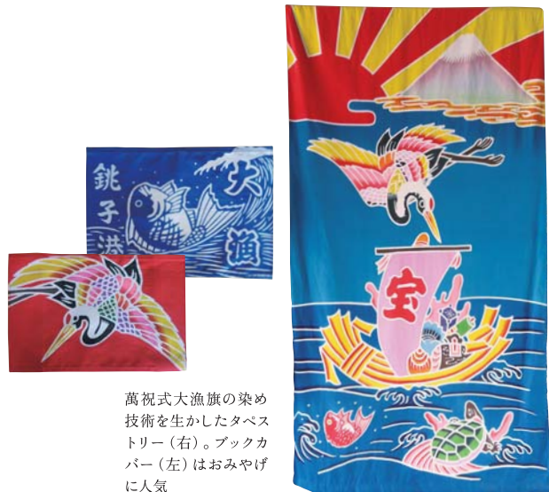
萬祝式大漁旗の染め技術を生かしたタベストリー（右）。ブツカバー（左）はおみやげに人気

縁起のよい図柄が散りばめられた大漁旗は、「海の男」たちの誇り。房総が発祥と伝わる萬祝式大漁旗の職人さんを訪ねてきました。 銚子の美味や風景を楽しむ関東最東端の夏旅に出かけませんか。