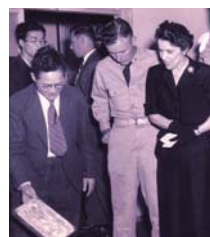
進駐軍でも玉虫塗は知られ た存在で、マッカーサー元帥 夫人も購入に訪れたそう

転機が訪れたのは、2011 年の東日本大震災。社屋は無 事だったものの、3ヵ月ほど営 業できない状態が続きました。 商品が売れない中で、玉虫塗の 価値をあらためて見直した結 果、「TOUCH CLASSIC」とい う新ブランドの立ち上げにつな がったといいます。 仙台ゆかりのデザイナーナ ちとコラボした製品は、黒を基 調としたクールなフォルム。ポ ウルもグラスも軽やかで持ちや すく、日々の生活が楽しくなり そうです。