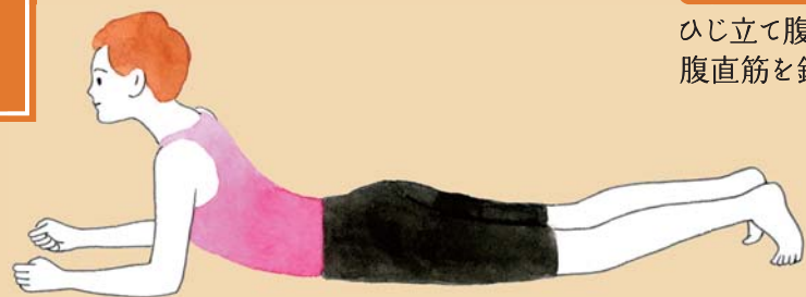
筋トレ体操 ひじ立て腹筋で 腹直筋を鍛える

何かと忙しく、冷えや体の不調を感じにくくなるこの時期。メンテナンスを怠ると膀胱炎、腎盂炎、風邪などの症状が。このストレッチは腹筋、背筋を同時に強くするので、これだけで強力なトレーニングになります。忙しい今こそ、寒さに負けないからだに変えましょう。