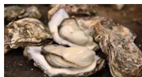
(右上) 仙台城跡の伊達政宗騎馬像 (左上) ケヤキ並木を彩る「SENDAI 光のページェント」。仙台の冬の風物 詩として親しまれています (右下) ぶつくりとした牡蠣。焼き牡蠣 はアツアツ、うまみたっぷり (左下) 松島という地名のルーツに なったという雄島。手前の渡月橋は震 災後再建されました