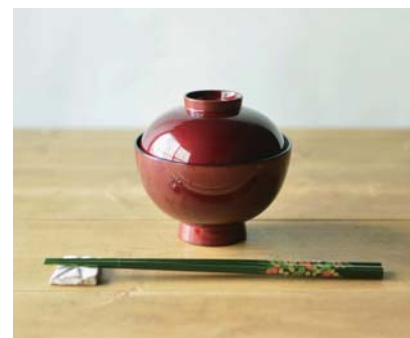
(メイン写真)「TOUCH CLASSIC」 ブランドの酒器。松徳硝子のグラス に玉虫塗で黒いグラデーションを施 しています。男性に人気。 (上・右) 彩色の美しさを、玉虫の羽 根にたとえた玉虫塗。シンプルな椀 の照りに注目。ワインカップは塗り と蒔絵の集大成 (左) 月明かりに照らされた松島

宮城県民におなじみの玉虫塗は、 実は輸出向けに開発された技術。 震災復興のために立ち上げた シックな新ブランドは、 人と人とのつながりから 生まれたものでした。