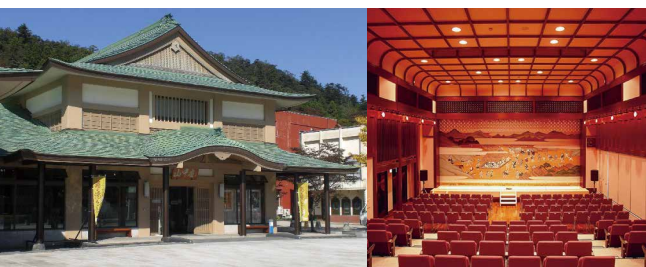
山中座外観と山中座ホール全景 伝統芸能「山中節」にふさわしい檜舞台と松羽目。山中漆器の技を尽くした格調高い造りにご注目。