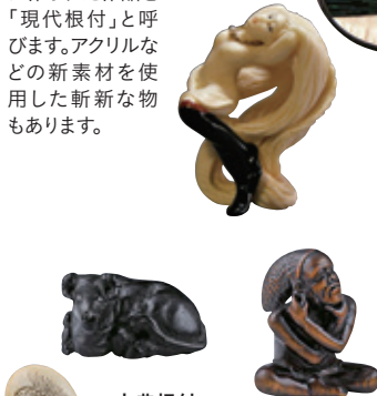
古典根付 安土桃山から使われていたといわれる根付。江戸時代には、武士、豪商、庶民が趣向を凝らした根付を使用していました。

住宅」を修復し、2007年に根付専門の美術館として開館しました。約5000点のコレクションの中から400点が常時展示され、風雅な空間に包まれ日本の伝統美を心ゆくまで鑑賞できます。 百貨店で開催される「根付展」には熱心なファンが詰めかけ、カルチャースクールでは、自分が使おうための根付を手作りする女性たちもいるとか。ネット世代の若者が新たな根付文化を継承していくのでしょうか。