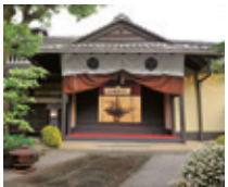
京都清宗根付館 根付専門の美術館として、唯一の根付館である「THE GOLDEN NETSUKE AWARDS」を設けるなど、根付文化の継承・発展に貢献しています。 https://www.netsukekan.jp

住宅」を修復し、2007年に根付専門の美術館として開館しました。約5000点のコレクションの中から400点が常時展示され、風雅な空間に包まれ日本の伝統美を心ゆくまで鑑賞できます。 百貨店で開催される「根付展」には熱心なファンが詰めかけ、カルチャースクールでは、自分が使おうための根付を手作りする女性たちもいるとか。ネット世代の若者が新たな根付文化を継承していくのでしょうか。