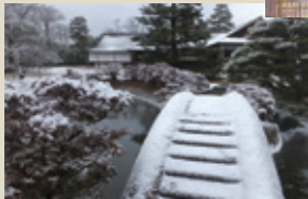
桂離宮 京都市西京区にある桂離宮は、玄和年間に八条智仁親王の別荘として創建されました。数寄屋造り書院と回遊式回廊庭園は必見です。