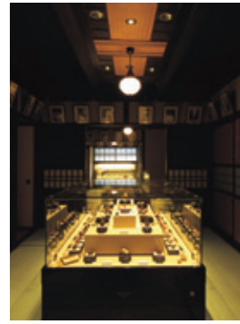
京都清宗根付館の展示室 5000点以上のコレクションから選りすぐりの逸品約400点の根付を常時鑑賞できます。(休日を除く)