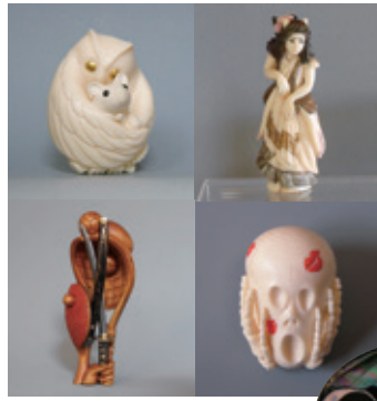
根付 主に戦後に作られた作品を「現代根付」と呼びます。アクリルなどの新素材を使用した斬新な物もあります。