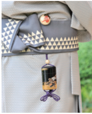
根付の使用例 印籠や煙草入などの携帯品に紐を結び、写真上のように帯りの下を通して根付で留めます。高価な材質や凝った意匠が求められました。