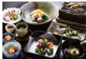
京懐石料理 懐石料理は、茶事の際に主催者が来客をもてなす料理のことで、茶の湯とともに京都で発展しました。京料理は、京野菜などの持ち味を活かした薄味が特徴といわれます。