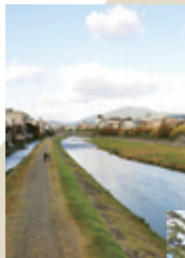
鴨川 京都市内を南北に流れる鴨川は、桜並木や納涼川床など、京都人に憩いと安らぎを与えてくれる場所として親しまれています。 ●写真: ©京都市メディア支援センター