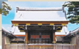
京都御所 京都市上京区にある旧皇居です。現在の建物は、1855年に再建されたもので、古式のままだと現存しています。