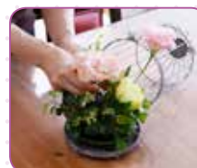
※使用したグリーンはビトスボラム