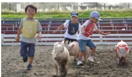
こぶたのレース レース開始前に抽選で選手(3歳~小学6年)を選抜。レース予想ができ、見事当たればプレゼントがもらえます。

ツアーの出發まで時間があるときは、それまで場内探索。各所で楽しいイベントやショーが行われているのでぞいてみましょう。名物「こぶたのレース」は、抽選で選ばれた子供たちがこぶたと一緒に猛烈ダッシュでゴールを目指します。周りの応援も力が入って大盛り上がり。アヒルの集団がお尻をふりふり、全力疾走で駆けまわる「アヒルの大行進」も必見。