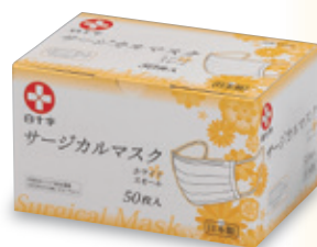
ホワイトスモール (約14.5cm×約9.5cm)