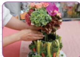
※1.なるべく外側に凹凸模様の少ないもの。 ※2.アスパラガス、セロリ、ニンジン、パセリなど