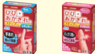
レギュラー 20枚入(薄さ0.007mm) ピンポイント 30枚入(薄さ0.05mm)