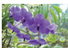
バンダ(ひすいらん)

フラワーセラピーは、花と触れあうことを通じて心身をリラックスさせ、ストレスや疲れ、悩みなどを解きほぐしてくれる癒しの効果があります。